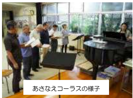
あさなえコーラスの様子

練習予定日は、10月4・11・18・25日の毎週金曜日となっております。時間は、13:30～14:20で、場所は音楽室です。多くのご参加をお待ちしております。