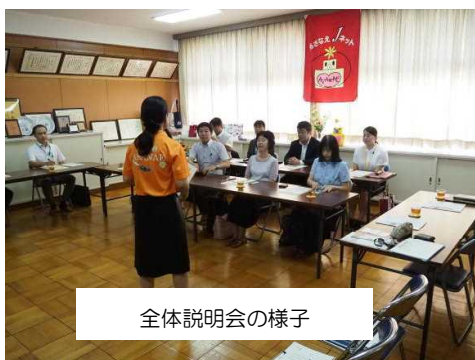
全体説明会の様子