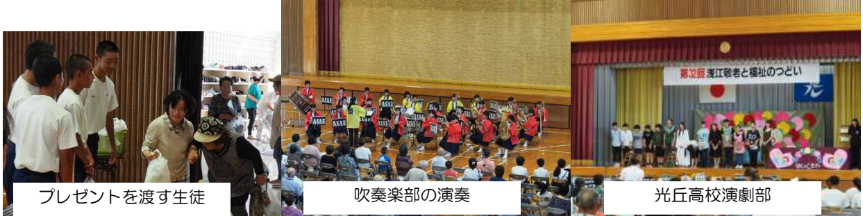
プレゼントを渡す生徒