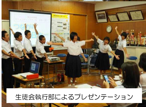
生徒会執行部によるプレゼンテーション

9月13日（金）に、別府市社会教育委員の会から6名、別府市教育庁社会教育課から2名、兵庫教育大から1名の方々が、研修視察に来られました。