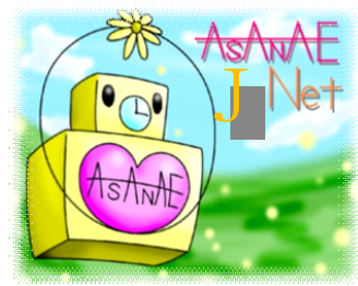
あさなえJネットマスコットキャラクター 「つながりん」

光市立浅江中学校コミュニティ・スクールだより 2019年度第1号 (5月7日発行)