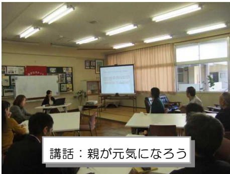
講話：親が元気になろう