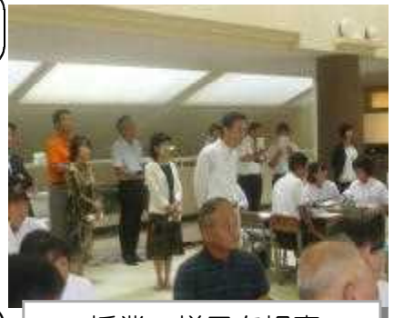
授業の様子を視察

視察団の方々からは、本校の生徒たちの心のこもった挨拶や熱心な授業の取り組み方、また生徒会執行部の堂々とした発表の様子にふれ、たいへん感心したとのお言葉もいただきました。また、本校の取組からコミュニティ・スクールの組織や運用の方法について具体的なイメージを得てくださったようです。今後、それぞれの学校において、素晴らしいコミュニティ・スクールの取組が実践されていくことを期待しています。