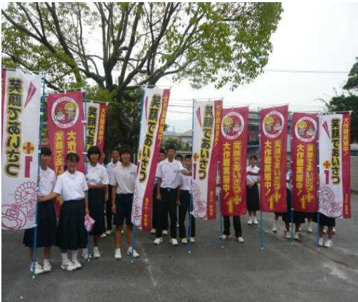
のぼり旗をもって挨拶運動