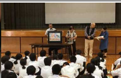
認知症サポーター養成講座