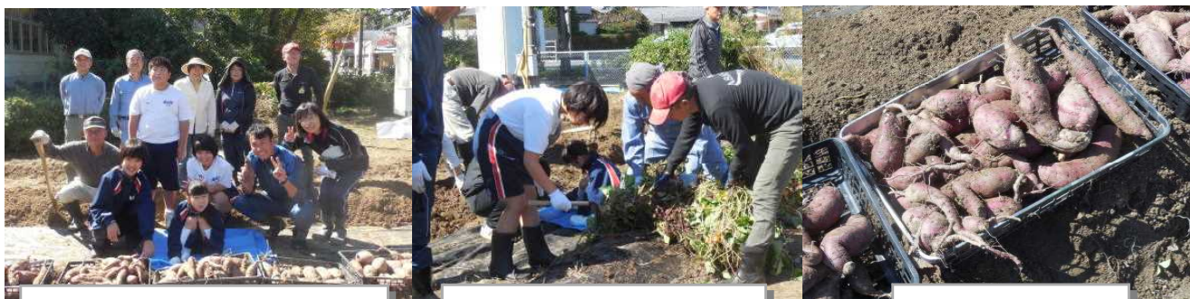
お世話してくださる地域の方々と