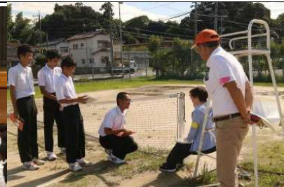
講座でのロールプレイ

「15歳は地域の担い手」のキャッチフレーズが定着してきた「あさなえJr.」の活動が、4年目となる今年も積極的に行われています。9月28日（木）には、あさなえ高齢者（認知症）見守りネットワークの協力を得て「認知症サポーター養成講座（2年生）・声かけ訓練（3年生）」を開催し、認知症の方との関わりについて学びました。また10月3日（火）の放課後には、食生活改善推進委員の皆さんと一緒に独居高齢者宅への弁当配達のお手伝いを行い、地域の現状を肌で感じる体験活動をさせていただきました。