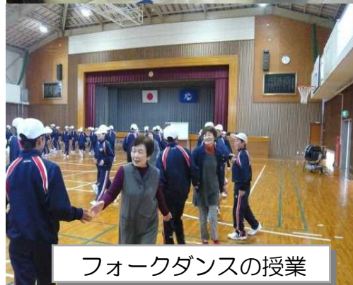
フォークダンスの授業