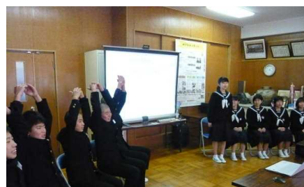
生徒会役員がCSの活動状況を発表

視察に来校された方々からたくさんの感謝や激励のお手紙等をいただいておりますが、一部紹介します。