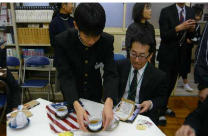
心を込めたおもてなし