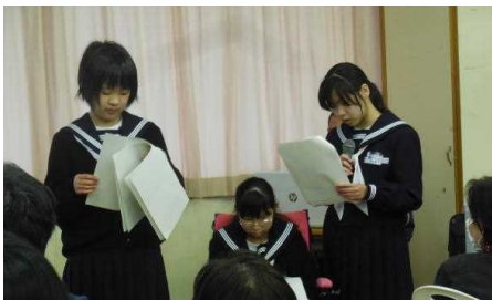
あさなえ学級代表生徒による地域とのつながりについての発表

ご参加いただいた地域の方々からは、「いつも生徒たちから元気をもらっているのだからできることがあればサポートしたい。」「浅江中学校に来ることが生き甲斐なので、これからも楽しみたい。」という感想をいただきました。