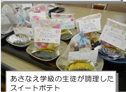
あさなえ学級の生徒が調理したスイートポテト