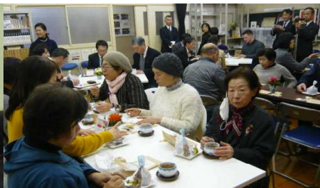
和やかな雰囲気の中で、地域の方々にも楽しんでいただきました