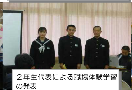
2年生代表による職場体験学習の発表