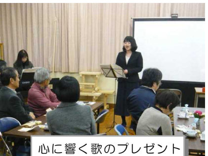
心に響く歌のプレゼント

如月のタベの会に向けてみんなでいろいろな準備をしてきました。例えば、技術の時間にスライドを作ったり、家庭科の時間にスイートポテトやフォンダンショコラなどを作りました。学活の時間には本番に向けて発表の練習をしました。本番では緊張してしまって練習のようにうまくできませんでしたが、如月のタベの会をして、地域の方々とふれあったり、喜んでもらえたりして、すごく嬉しかったです。