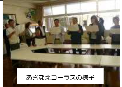
あさなえコーラスの様子

6日（金）、13日（金）いずれも13時30分から1時間を予定しておりますので、お気軽にご参加ください。