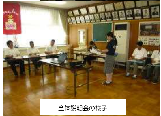
全体説明会の様子