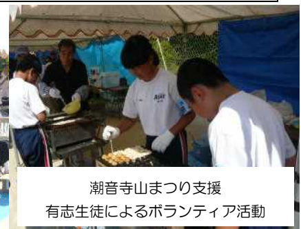
潮音寺山まつり支援 有志生徒によるボランティア活動

新年度がスタートして、3か月が経ちます。あさなえJネットに掲げた「重点取組事項」「基本プラン」とも軌道にのり、充実した活動が繰り広げられています。