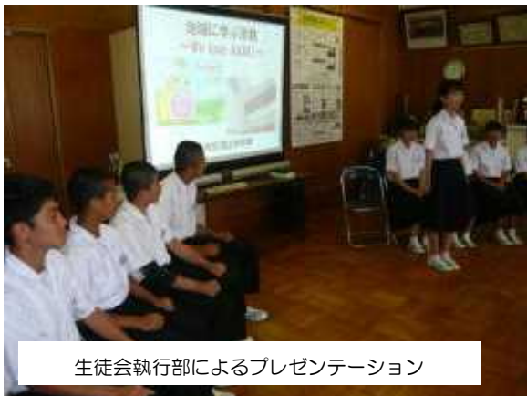
生徒会執行部によるプレゼンテーション