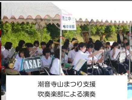
潮音寺山まつり支援 吹奏楽部による演奏