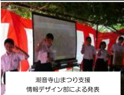
潮音寺山まつり支援 情報デザイン部による発表