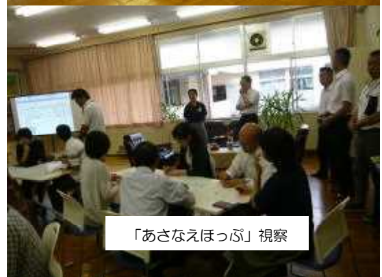
「あさなえほっぷ」視察