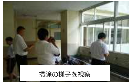
掃除の様子を視察

昼食後、生徒会執行部の生徒による「あさなえJネット」の活動紹介のプレゼンテーションを行いました。あまりの発表の素晴らしさに、「どれくらい練習し、どのように台詞を覚えられたか。」と生徒たちに質問されました。午後からは、初の「あさなえカフェ」や「ふれあい促進授業（2年生対象）」を見学されました。すべての学年・すべてのクラスにおいて、生徒たちの授業態度や生活態度の素晴らしさに感動されていました。