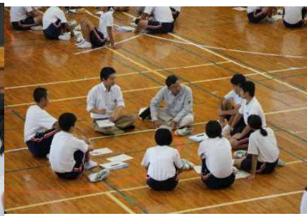
声かけ訓練の振り返り

「15歳は地域の担い手」のキャッチフレーズが定着してきた「あさなえJr.」の活動が、5年目となる今年も積極的に行われています。9月25日（火）には、あさなえ高齢者（認知症）見守りネットワークの協力を得て「認知症サポーター養成講座（2年生）・声かけ訓練（3年生）」を開催し、認知症の方との関わりについて学びました。