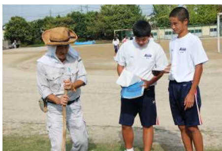
講座でのロールプレイ