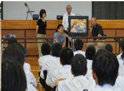
認知症サポーター養成講座