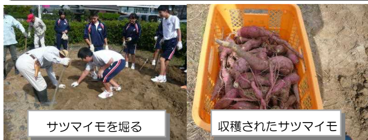
サツマイモを掘る