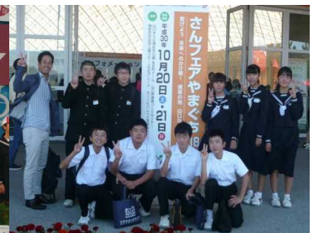
△発表後、会場前で記念撮影