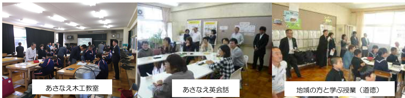
あさなえ木工教室

昼食後、代表生徒（あさなえJr.、執行部）による「あさなえJネット」の活動紹介や「産業教育フェア山口大会」（※表面参照）のプレゼンテーションを行いました。発表の素晴らしさに感動されていました。