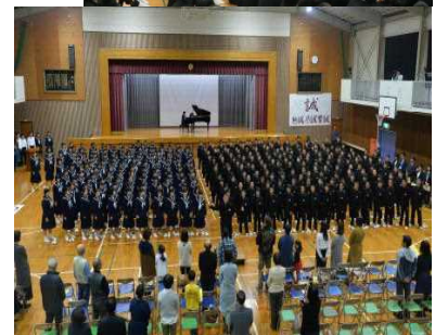
△エンディングで「ふるさと」を合唱