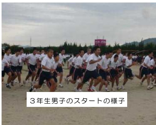
3年生男子のスタートの様子