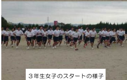
3年生女子のスタートの様子

11月18日（日）に、浅江地区コミュニティ協議会との共催で、体力づくり部会の基本プランである「ふれあい元気マラソン」が実施され、全校生徒が参加しました。当日は、少し肌寒い曇り空でしたが、男子は10km・女子は7kmのコースに挑みました。生徒たちは、平素からの体育の授業や部活動の練習の中で培った力を発揮して、力強く走り抜くことができました。また、地域の方々、卒業生とふれあいながら、さわやかな汗を流すことができました。