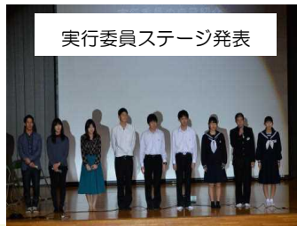
実行委員ステージ発表

11月11日(日)に本校にて「浅江中CS10周年記念事業」を開催しました。本事業は卒業生・在校生の代表が中心となって企画・運営をし、現在の「地域・家庭・学校」という「横のつながり」とともに、卒業した人と「地域・学校」の「縦のつながり」の一層の充実を祈念して行われました。まさに、浅江中CSのキャッチフレーズである「つながり日本一」を体感できるイベントとなりました。当日は、多数の皆様方にご来校いただきまして、誠にありがとうございました。