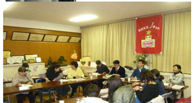
PTA常任委員会でも、あさなえJネットの取組について報告・協議をしました。

冬休み前に、心の教育部会から配布された「家庭でのSNSの使用ルール」についての話題となりました。「他の家庭でどのようなルールを作っているのか知りたい。」という意見などが挙がり、生徒だけでなく、保護者の方の意識も高まり、効果が上がるのではないかと感じられました。今後、SNSの取組をさらに発展させるために、地域・家庭・学校が一体となった取組を一層進めていきたいと思っております。