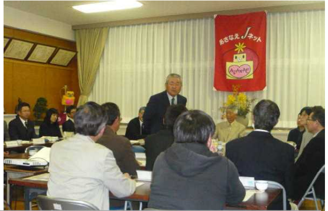
今回も多くの皆様のご参加を得て、充実した学校運営協議会となりました。

1月7日（月）18時30分より本校応接室において、学校運営協議会の委員の皆様、企画推進委員の皆様、光市教育委員会事務局の皆様のご出席をいただき、「第3回あさなえJネット学校運営協議会」を開催いたしました。今回は、「第3回企画推進委員会（12/25）」における各プロジェクト部会の協議結果やいじめ対策委員会の報告をはじめとして、11月上旬に実施した本年度の本校第2回学校評価の結果についての報告を踏まえて協議をしていただく中で、今後の浅江中学校の教育活動に関する様々な御意見をいただくことができました。なお、今回の学校運営協議会での協議内容及び主な報告事項は以下の通りです。