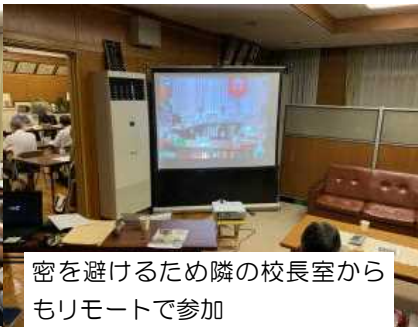
密を避けるため隣の校長室から リモートで参加