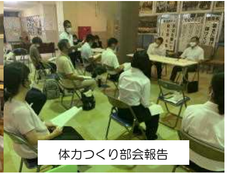
体力づくり部会報告