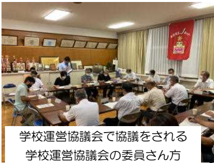
学校運営協議会で協議をされる 学校運営協議会の委員さん方

8月28日(金)、浅江中学校コモンホールにおいて、本年度第2回の「あさなえJネット学校運営協議会」が開催されました。今回の会議では、3つの部会(心の教育部会・学力向上部会・体力づくり部会)から、これまでの活動報告及び今後の取組についての検討が行われました。また、8月24日(月)に開催された「あさなえネット熟議」や新型コロナウイルス感染症対策を踏まえた体育祭・文化祭への取組について報告がされました。