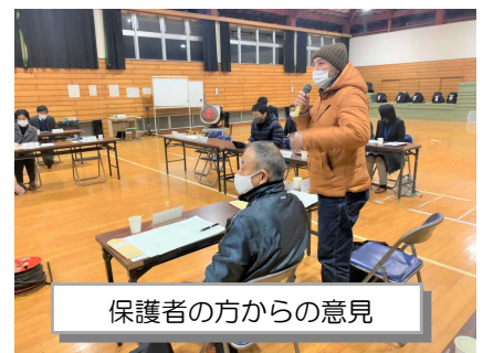
保護者の方からの意見