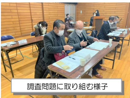
調査問題に取り組む様子

1月7日（木）、第3回あさなえJネット学校運営協議会を開催しました。今回の主な協議内容は、「浅江中生とのこれからの時代に求められる力」についてです。本校3年生は、今年の全国学力・学習状況調査で、国語、数学とも県平均を大きく上回っていましたが、中には正答率の低かった問題もありました。その問題について、参加者の方々に実際に解いていただきました。生徒につけたい力の一つ「コミュニケーション能力」をつけるためにどうすればよいかについて、「日常の会話や遊びで練習する」「異年齢と交流する」「自己肯定感を高める」など、数々の貴重なご意見をいただきました。その後、「学校評価」「あさなえJネットの事業」についての報告、コーディネーター様・光市教育委員会様からのご助言をいただき、会を終えました。残り3か月の学校生活を、さらに充実させるための価値ある時間となりました。