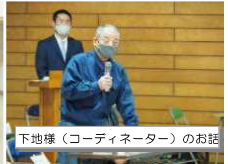
下地様（コーディネーター）のお話