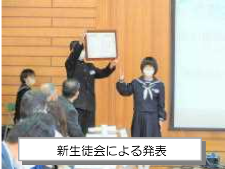
新生徒会による発表

部会別協議で出された意見は、1月7日（木）に行われた学校運営協議会で協議題として取り上げ、今年度の成果と課題を地域全体で共有しました。