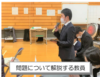
問題について解説する教員