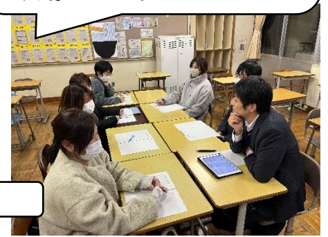
PTA プロジェクト部会