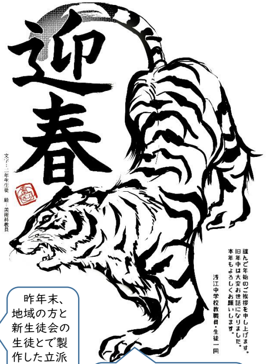
文字：二年生生徒 絵：美術科教員

昨年未、地域の方と生徒会の生徒とで製作した立派な門松が、新春の正門で生徒の登下校を見守りました！！