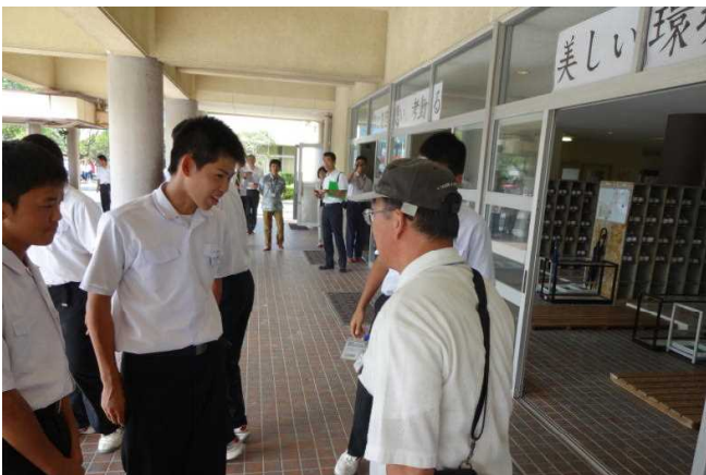
「認知症の方への声かけ訓練」の様子。たくさんの方に見られて生徒たちも緊張気味。