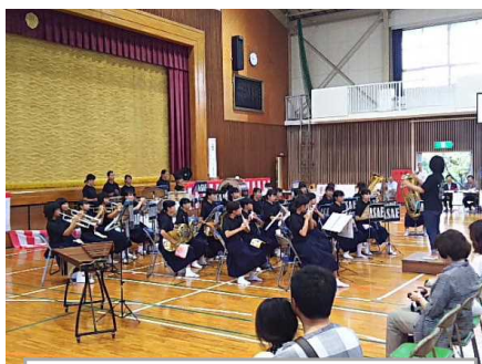
吹奏楽部による演奏

9月18日（日）、本校体育館を会場に、浅江地区コミュニティ協議会主催の「第29回浅江敬老と福祉のつどい」が開催されました。