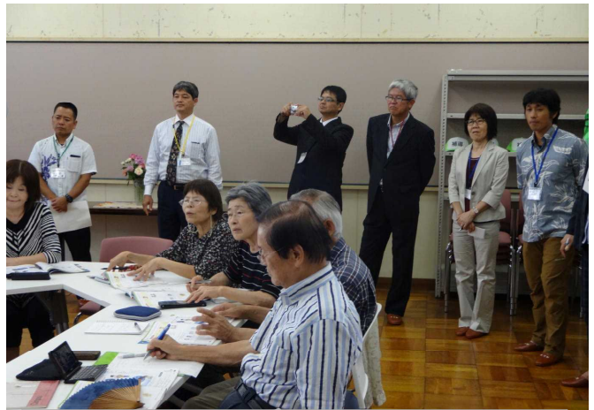
「あさなえ英会話教室」の様子を参観されました。