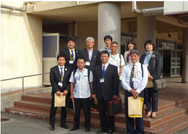
今回来校された沖縄県名護市の皆さん

視察団の方々からは、本校の生徒たちの心のこもった挨拶や熱心な活動の様子にふれ、たいへん感心したとのお言葉もいただきました。また、本校の取組からコミュニティ・スクールの組織や運用の方法について具体的なイメージを得てくださったようです。今後、名護市のそれぞれの学校において、素晴らしいコミュニティ・スクールの取組が実践されていくことを期待しています。