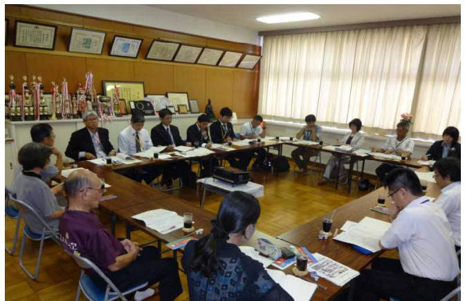
質疑応答の時間では、特に地域の方々と学校との連携の方法について質問が集中しました。