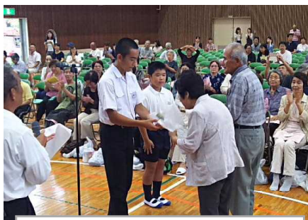
手作りの「青竹踏み」贈呈