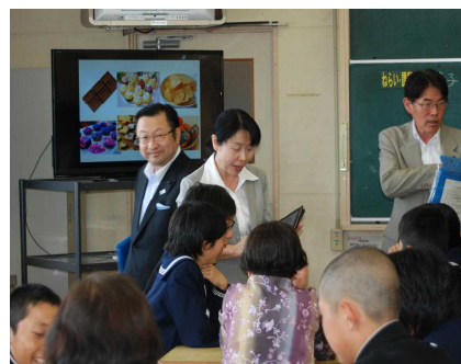
あさなえ美術教室