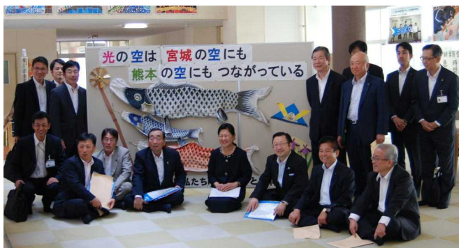
コモン・ホールで記念撮影 (議員・随行の方々と校長)

5月19日(木)に、山口県議会文教警察委員会の委員である県会議員の皆様が、浅江中学校のコミュニティ・スクール「あさなえJネット」の取組を視察するために訪問されました。