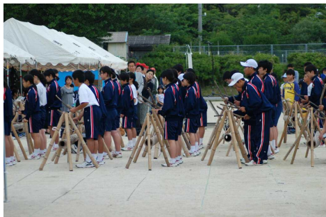
オープニング演奏

また、当日は生徒会執行部が熊本震災復興支援のための募金を行いました。多くの方々の御協力をいただきありがとうございました。いただいた募金は、光市総合福祉センター（あいぱーく光）を通じて被災地の復興支援に充てられることになっています。