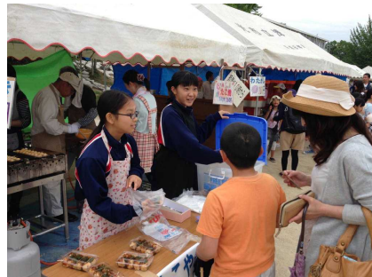
バザーのお手伝い