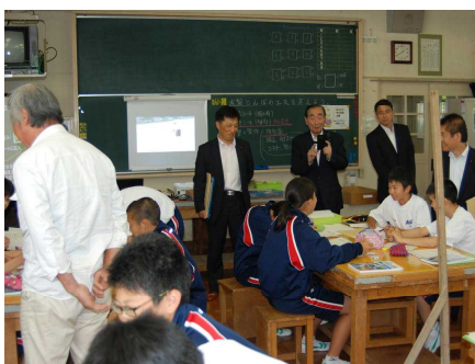
あさなえ木工教室