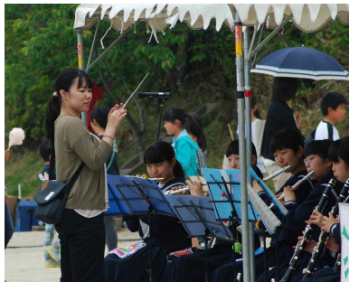
吹奏楽部による演奏