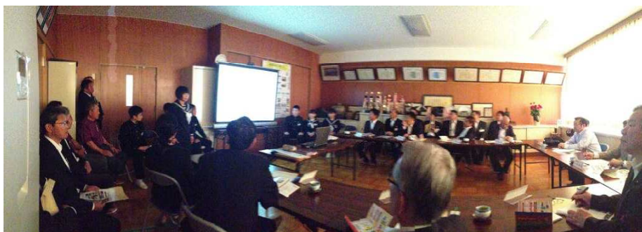
生徒会執行部によるあさなえJr活動のプレゼンテーション

また、プレゼンテーション後の質疑応答では、議員の皆様から生徒への質問が出されましたが、生徒が堂々と、しかも的確に回答する姿は、大変頼もしいものでした。