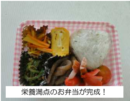
栄養満点のお弁当が完成！