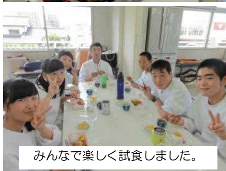
みんなで楽しく試食しました。