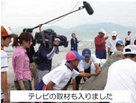
テレビの取材も入りました