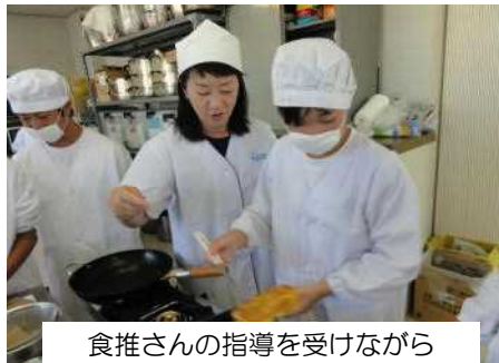
食推さんの指導を受けながら