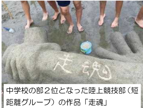
中学校の部2位となった陸上競技部（短距離グループ）の作品「走魂」