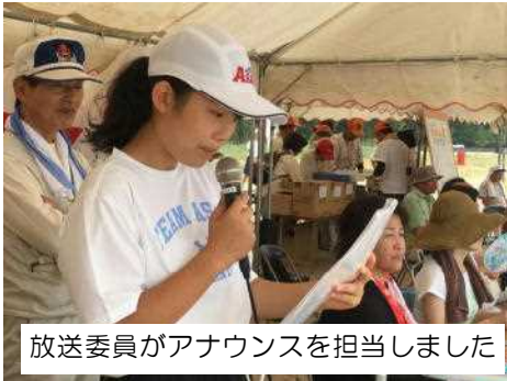
放送委員がアナウンスを担当しました