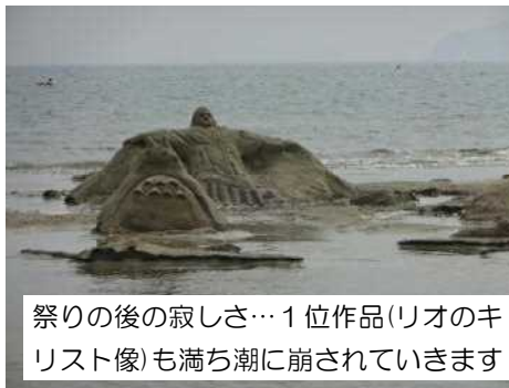
祭りの後の寂しさ…1位作品(リオのキリスト像)も満ち潮に崩されていきます

毎年恒例の「サンドアートin光」が、今年も8月3日（水）午後、虹ヶ浜海水浴場において開催されました。浅江中学校の生徒たちは部活動ごとのグループで砂像づくりに参加することはもちろん、テント設営・撤去や開閉会式のアナウンスなど、さまざまな場面で行事の運営に貢献しました。